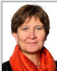
Forbundsleder i Fagforbundet Januar 2020

får du ved å ringe medlemstelefonen på 416 06 600 eller på lofavor.no .