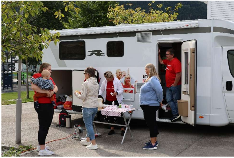
Bubiltur i samband med kommune -og fylkestingsvalet 2023