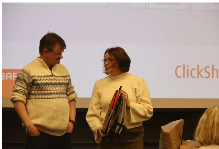
(frå årsmøte januar 2023,innvalt som leiar)

Det å vera leiar for Fagforbundet i Sogndal har vore eit kjekt og innhaldsrikt verv, med mange oppgåver og gjeremål.