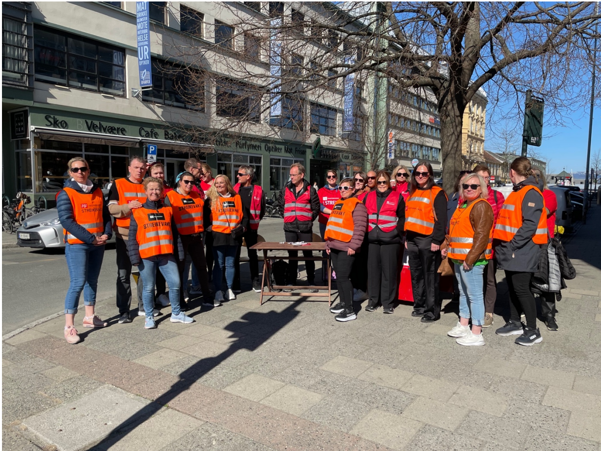
Streikemaking med medlemmer i NHO