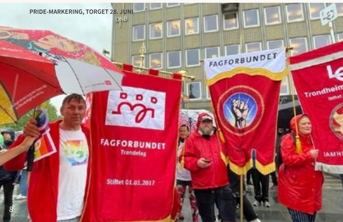
PRIDE-MARKERING, TORGET 28. JUNI

Noe står i glassmonter i kantina på Bydrifts sentralanlegg på Valøya, noe står i glassmonter i kontorfellesskap i Folkets hus og det resterende er på fagforeningskontoret. Vase, gave fra Fagforbundet Trøndelag gitt på stiftelsesmøte, står på Kattem, hos Vaktmesterklubben.