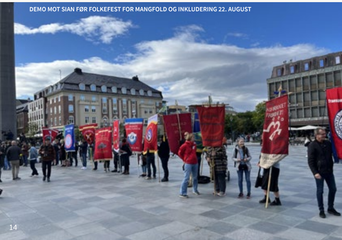
DEMO MOT SIAN FØR FOLKEFEST FOR MANGFOLD OG INKLUDERING 22. AUGUST