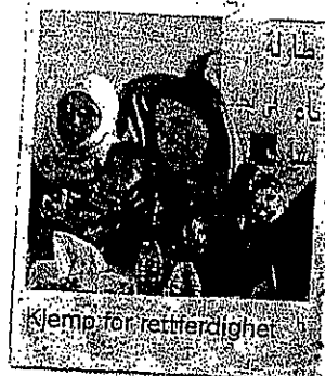
Kjemp for rettferdighet