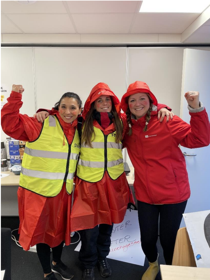
Barnehagestreik 2022