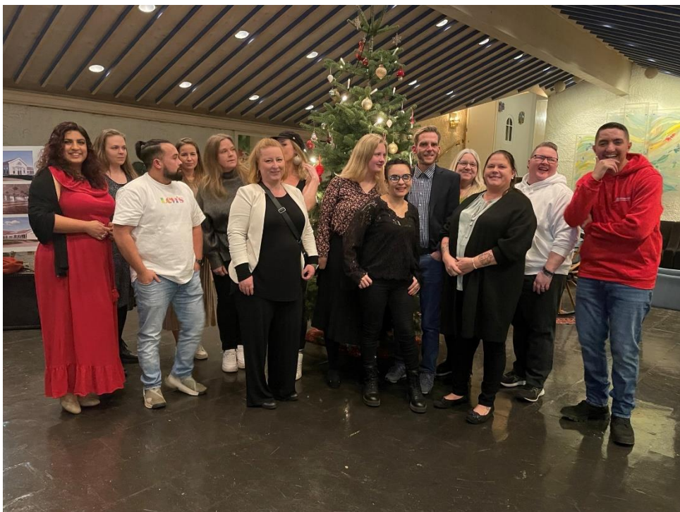
Fase 2 skoloring.