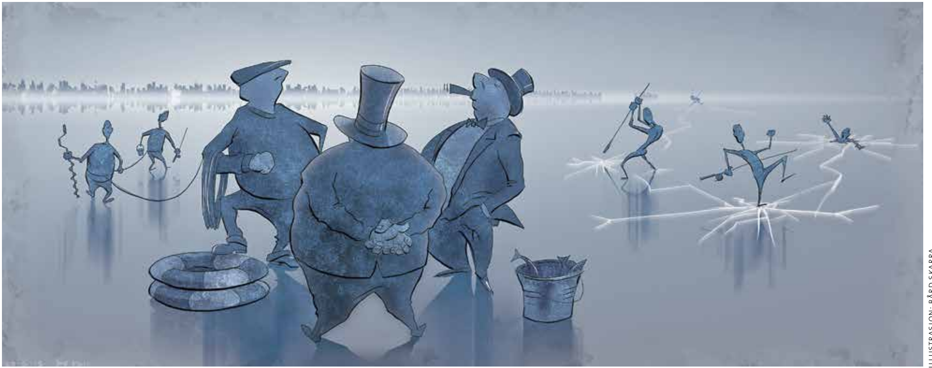
ILLUSTRASJON: BÅRD SKARRA