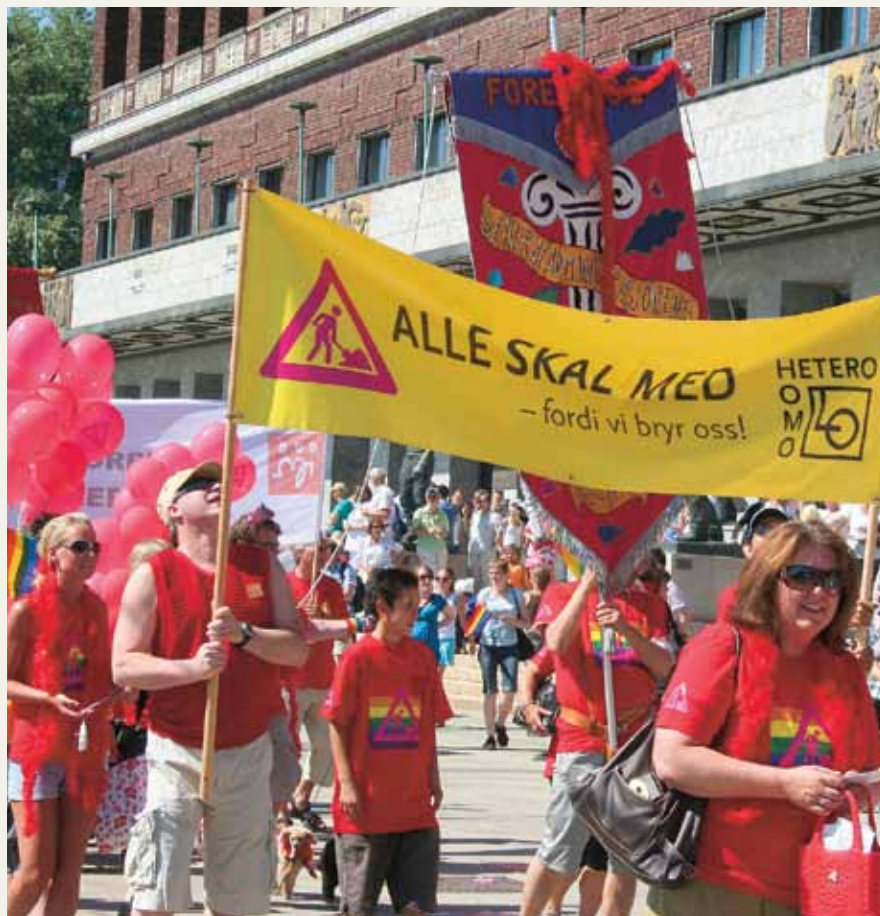
Stolt og synlig: LO og Fagforbundet Akershus i paraden under Skeive dager 2009.

Også Internasjonalen for stats- og kommuneansatte (ISKA) ble i sommer priset for innsats mot diskriminering av homofile, lesbiske, bifile, og transseksuelle (HLBT). Veilederen «Trade Unionists together for LGBT Rights», utgitt av ISKA og Utdanningsinternasjonalen, er framhevet i Københavnkatalogen. Københavnkatalogen er en eksempelsamling på 24 initiativer fra hele verden som setter menneskerettighetene til HLBT i fokus. Katalogen ble satt sammen til konferansen om menneskerettigheter under World Outgames i København i juli. Norsk LO og flere av ISKA-organisasjonene deltok.