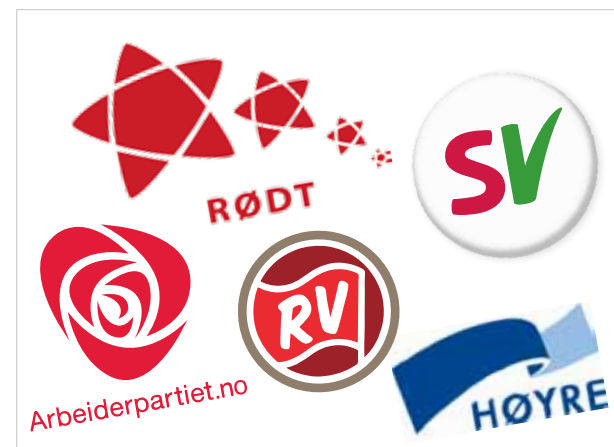
MONTASJE: KJELL OLUFSEN