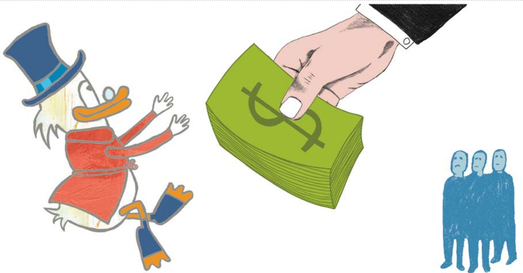
illustrasjon: trude tjensvold