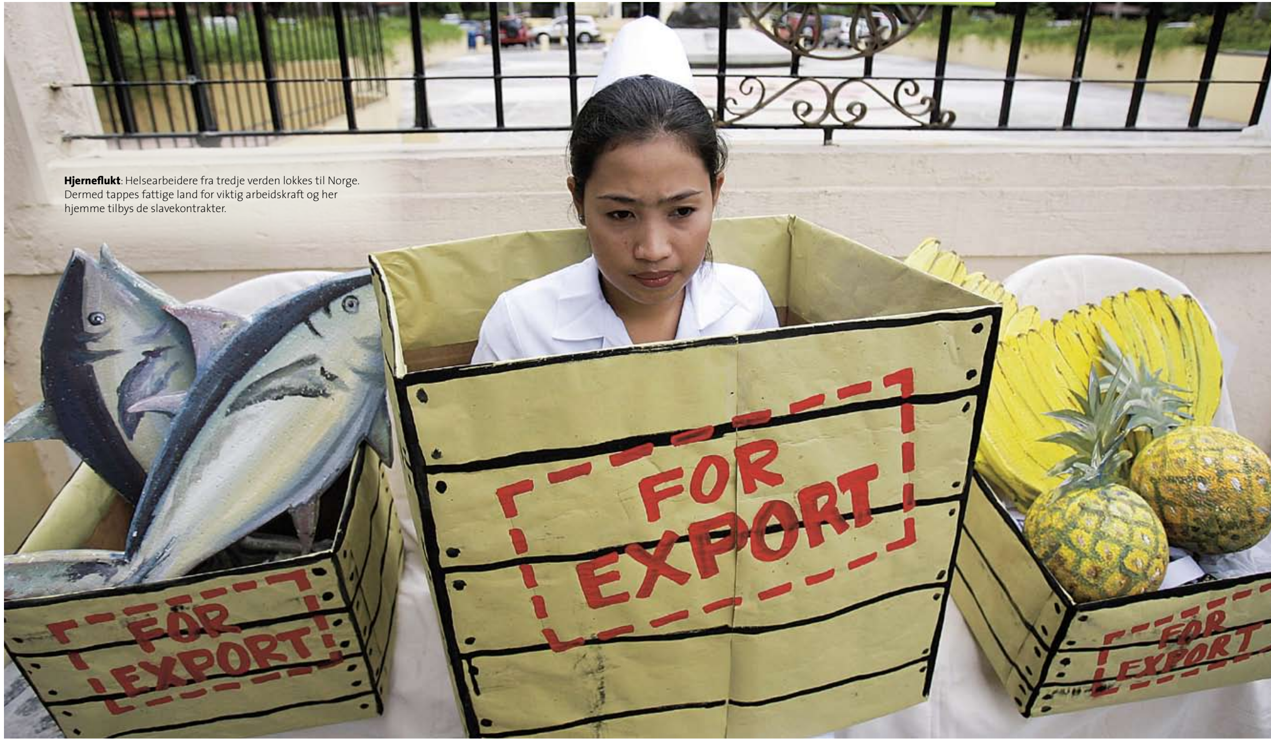
Hjerneflukt: Helsearbeidere fra tredje verden lokkes til Norge. Dermed tappes fattige land for viktig arbeidskraft og her hjemme tilbys de slavekontrakter.