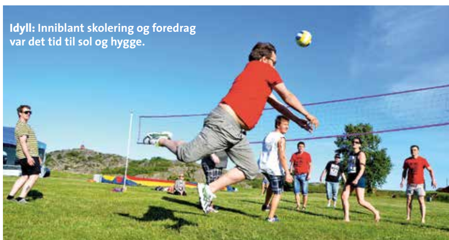
Idyll: Inniblant skoloring og foredrag var det tid til sol og hygge.

■ Fagforbundet har nå 337 629 medlemmer – en økning på 309 siste uka og 2133 i år.