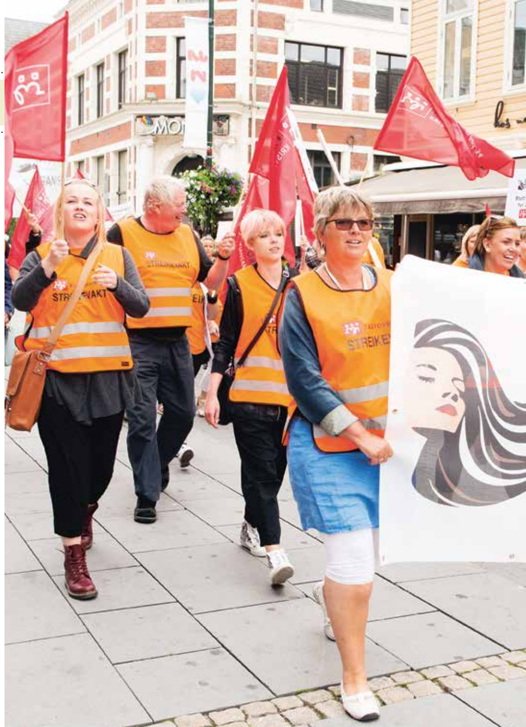
Frisører i flokk: I Kristiansand gikk frisørene i tog for heving av minstelønna. Med slagordet «La håret gro» - aksjonen «La håret gro», med støtte fra hele inn- og utland.

Fagforbundets tøffe frisører har gjennomført en 15-dagers streik. Frisørene har fått gjennomslag for det de streiket for - blant annet heving av minstelønna og ulempetillegget.