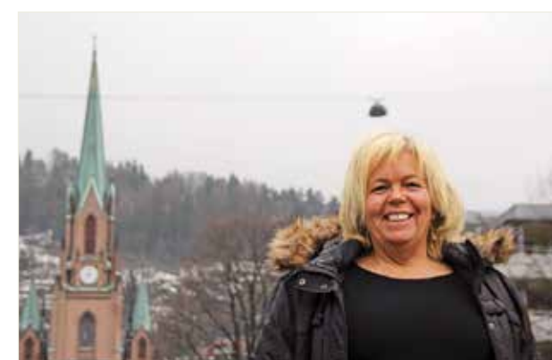
ILL.: KARI-SOFIE JENSENE