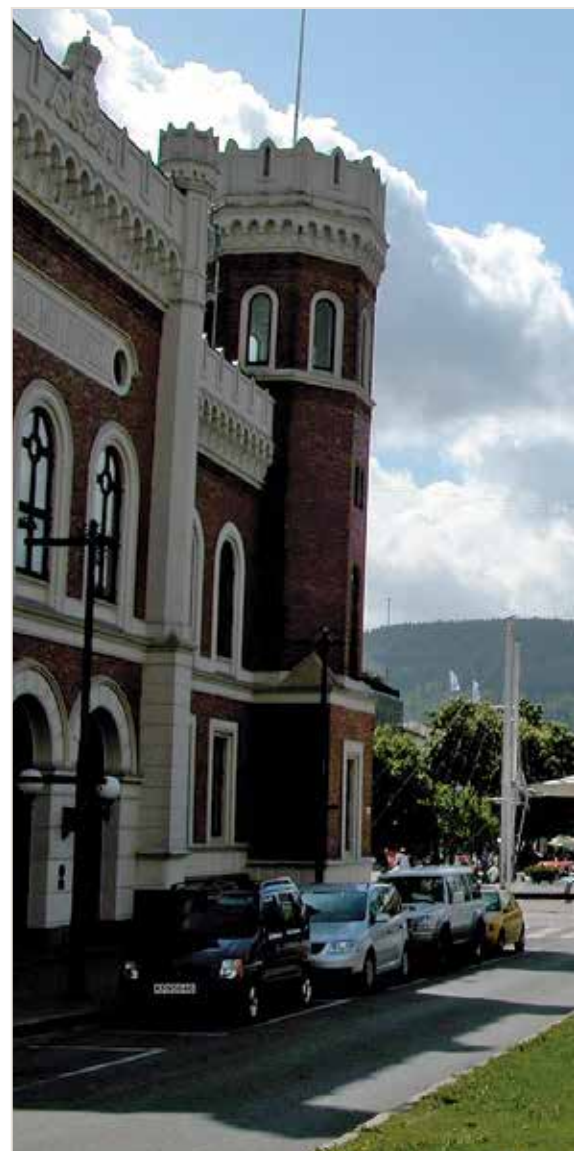
Skitten bransje: Drammen kommune har kvittet seg med Bransjen de tidligere kommunalt ansatte er kastet ut i er

– Det er selvsagt de ansatte som ikke lenger er en del av den kommunale pensjonskassa som har betalt prisen, av egen lommebok. I kommunene i dag be-