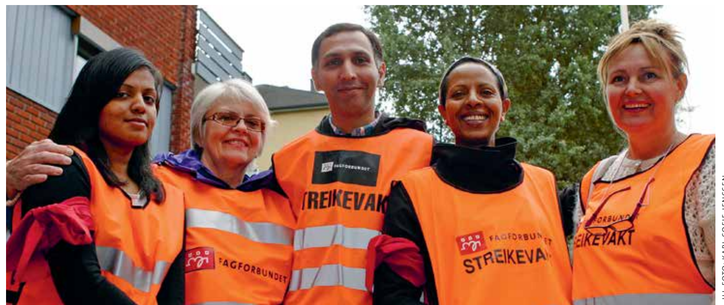
Tariffoppgjør: Arbeidstakersida gjør jobben sin og vil sikre kjøpekrafta til medlemmene.