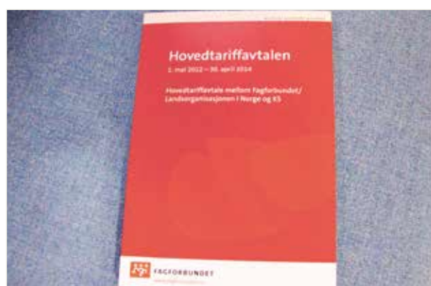
ILL. FOTO: KARI-SOFIE JENSENE