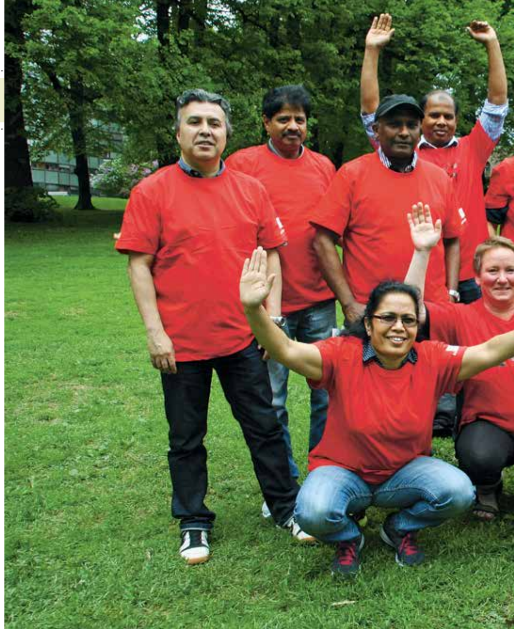
Vi er klare: Pensjonsjungelen kan være en utfordring for tillitsvalgte i Fagforbundet. Denne gjengen glade t

– De offentlige tjenestepensjonsordningene er under kraftig press. Det er grunn til bekymring når NHOs leder Kristin Skogen Lund sier at pensjonsordningene i offentlig sektor må bli mer lik ordningene i det private. Hun vet godt at mange offentlig ansatte er lavtlønte og jobber deltid, og hun vet at mange presses over i uførepensjon blant annet fordi jobbene er for tunge. Det er uanstendig