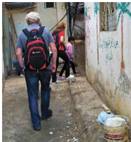
Ambassadører anno 2013: Besøk i Shattila camp i Beirut.

Siden at fylkene denne gangen vil foreslå to kandidater, vil noen av dem som allerede er ambassadører i dag forsette, mens andre ikke blir med. Det er opp til fylkene å vurdere hva som er best for fylket: Kontinuitet eller helt nye for å spre engasjementet mest mulig i organisasjonen. Fylkene har frist til 15. januar med å komme med forslag. Det blir ambassadørsamling 17. februar.