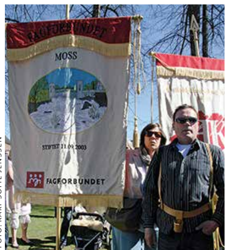
Husk: Nye valgeregler i fagforeningene.

Siden valgkomiteen som skal forberede kommende valgene allerede er valgt etter gamle regler, er det viktig at styrene drøfter om disse komiteene eventuelt bør suppleres slik at seksjonene, ungdommen og pensjonistene blir representert.