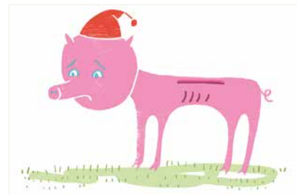
ILL.: TRUDE TIENSVOLD