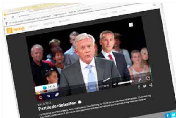
ILL. SKJERMUMP - TV2 SUMO