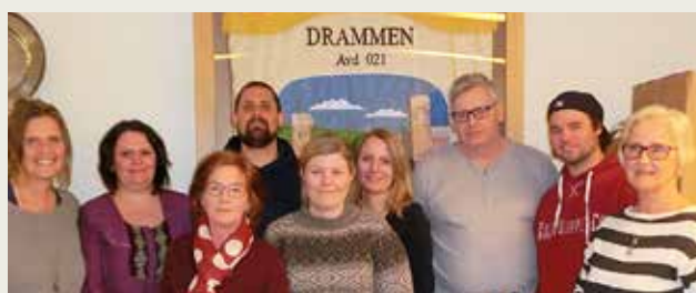
Fagforbundet Drammen har nå åtte nye tillitsvalgte som har gått gjennom fase1-kurs.