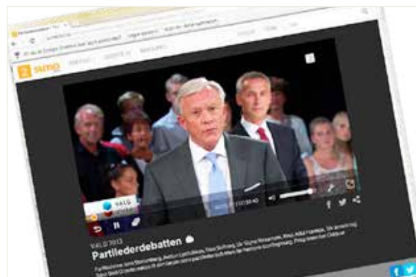
ILL. SKJERMDUMP – TV2 SUMO