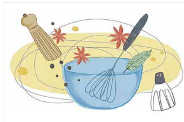
ILL: TRUDE TJENSVOLD