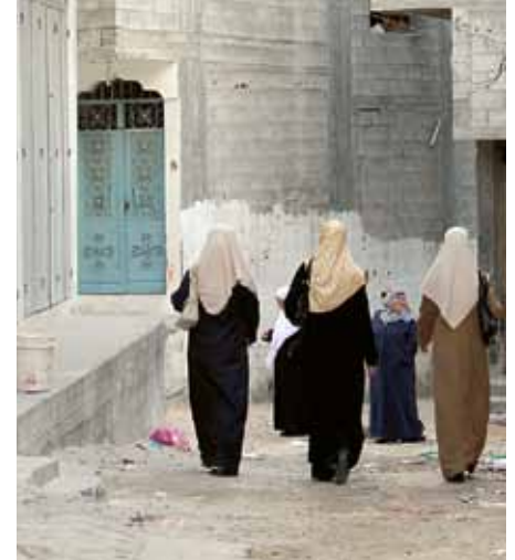
Gatebilde fra Ramallah på Vestbredden.