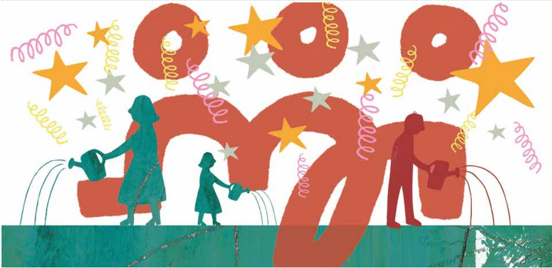
ILLUSTRASJON: TRUDE FJENSVOLD