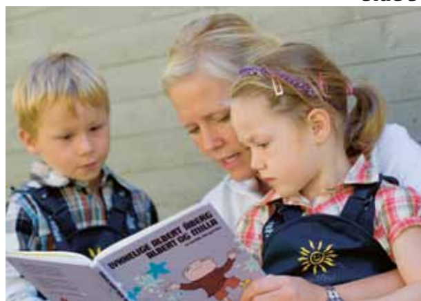
ILL. FOTO: TROND ISAKSEN