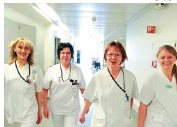
ILL. FOTO: JAN LILLEHAMRE