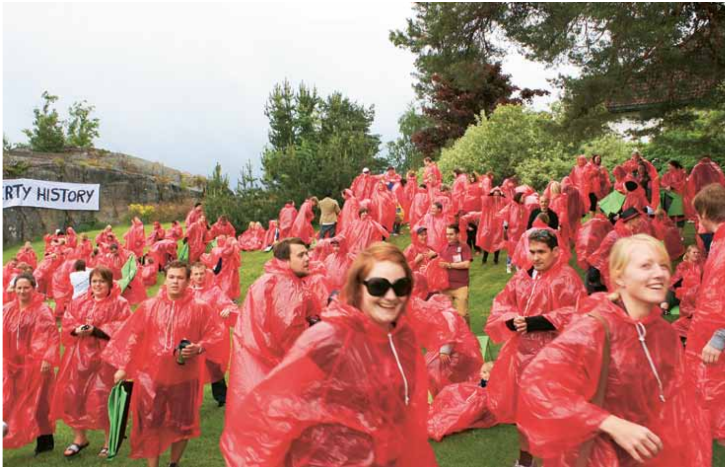
Rød i regnvær: Det regna under åpninga av Sommerkonferansen 2010 på Stavarn.