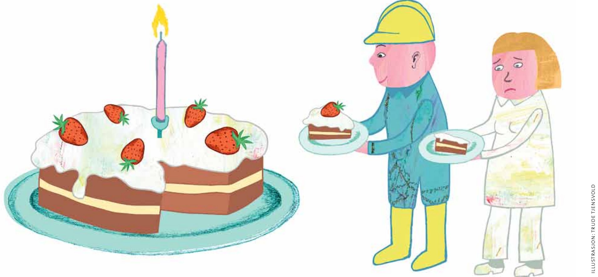
ILLUSTRASJON: TRUDE TIENSVOLD