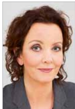
SUNNIVA ØRSTAVIK Likestillings- og diskrimineringsombud