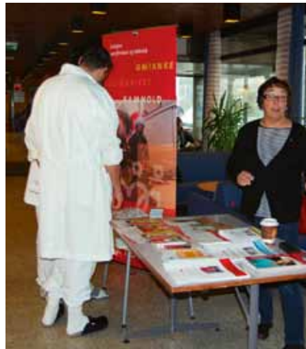
Fagforbundet på stand på sykehuset i Hamar i 2009