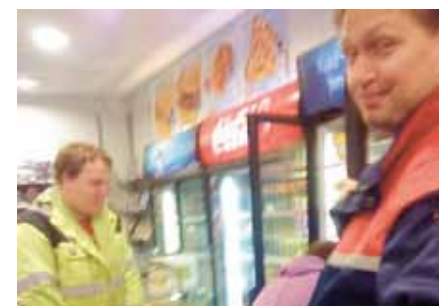
For å komme fra Mathopen til medlemmene på Alvøen skole, ble en snarrådig SST-leder hjelpemannskap for disse melkesjåførene.