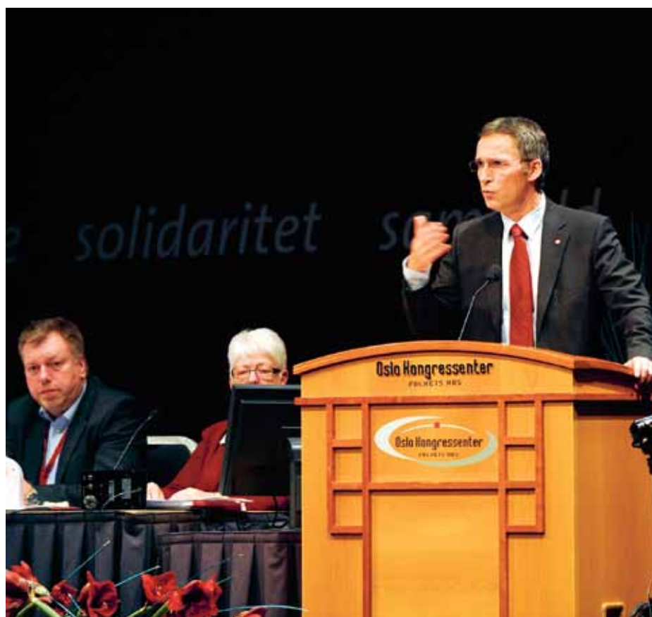
Ønsker kritikk: Statsminister Jens Stoltenberg.

– Det er mange grunner til at vi har et høyt sjukefravær, fortsatte han. En stor del av den voksne befolkningen er i arbeid, det innebærer at også folk med ulike helseproblemer er i arbeid. I mange andre land hadde disse stått utenfor arbeidslivet. Jeg vil heller ha et land med høy sysselsetting og høyt sjukefravær, enn lav sysselsetting og lavt sjukefravær. Men når det er sagt går sjukefraværet for