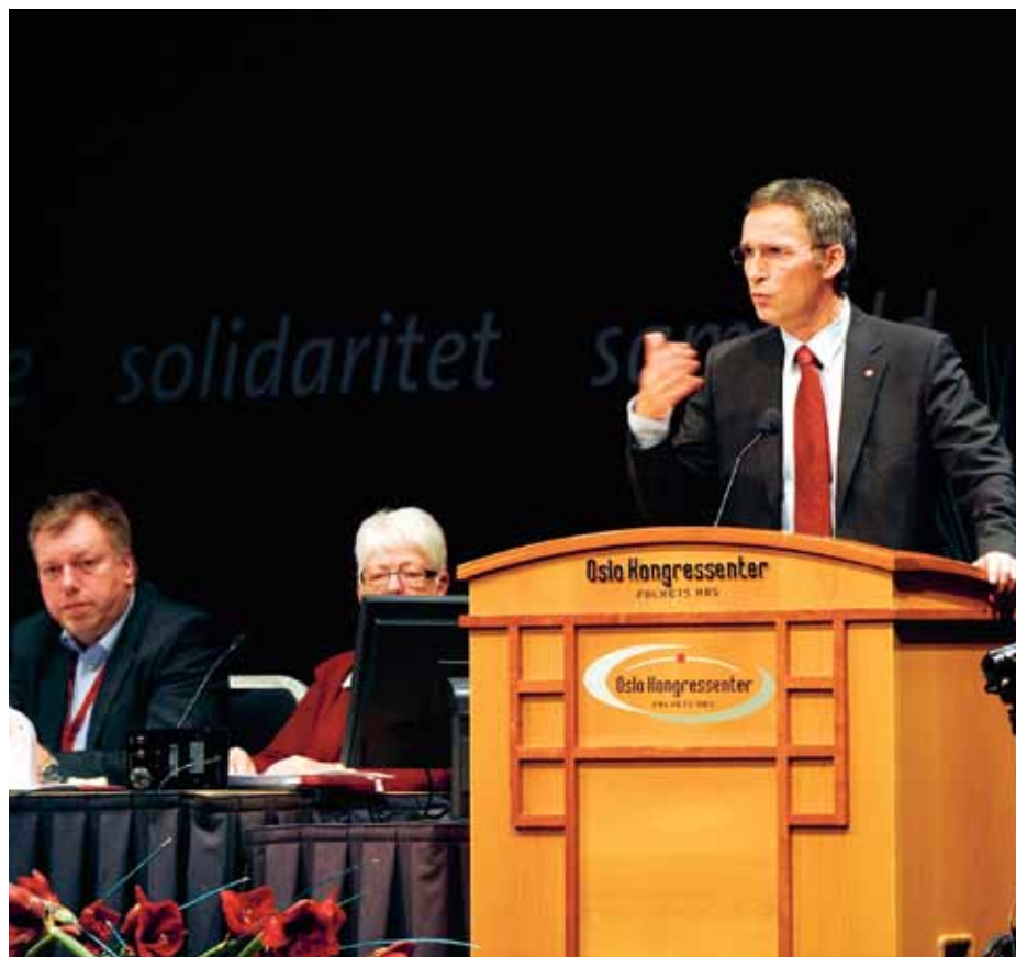
Ønsker kritikk: Statsminister Jens Stoltenberg.

– Det er mange grunner til at vi har et høyt sjukefravær, fortsatte han. En stor del av den voksne befolkningen er i arbeid, det innebærer at også folk med ulike helseproblemer er i arbeid. I mange andre land hadde disse stått utenfor arbeidslivet. Jeg vil heller ha et land med høy sysselsetting og høyt sjukefravær, enn lav sysselsetting og lavt sjukefravær. Men når det er sagt går sjukefraværet for