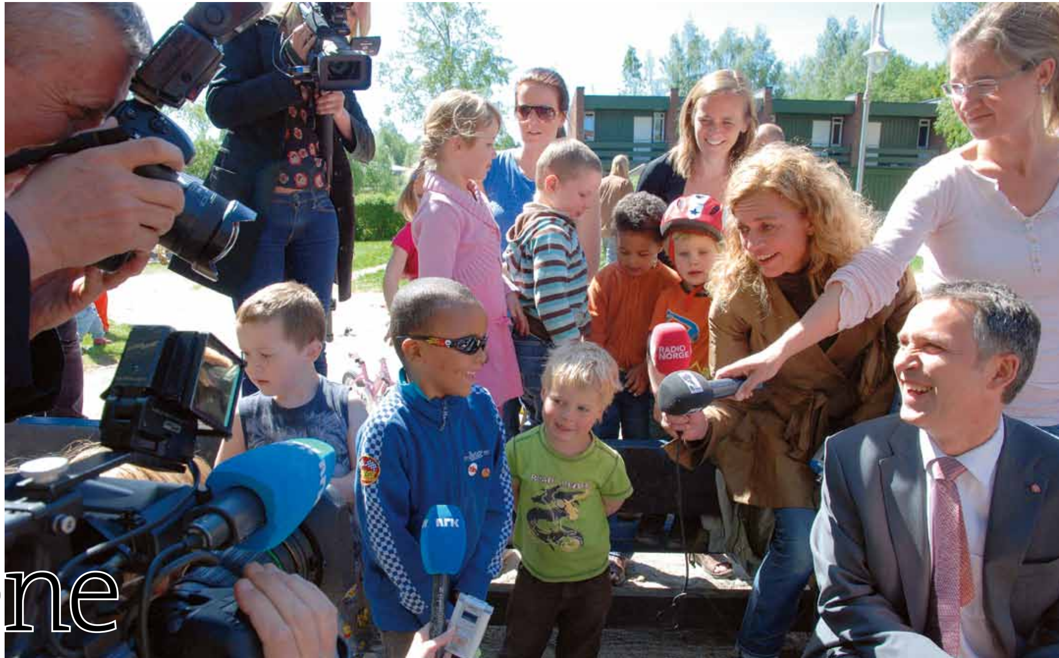
Styrket: Den rødgrønne regjeringa styrker offentlig sektor i budsjettet for 2010. Bra for velferden, mener Fagforbundet. På bildet legger Jens Stoltenberg fram meldingen om kvalitet i barnehagene.