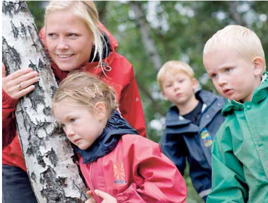
ulikt: Både jobben og barna er de samme, men lønn og arbeidsbelastning er svært ulik i private og kommunale banehager. Illustrasjonsfoto fra Gaustadskogen barnehage.

– Det er selvfølgelig flere ansatte i en barnehage der en eller flere av ungene