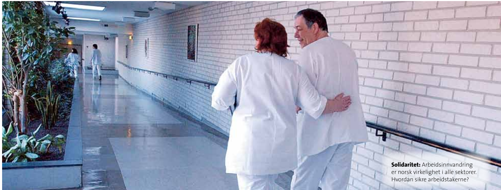
Solidaritet: Arbeidsinnvandring er norsk virkelighet i alle sektorer. Hvordan sikre arbeidstakerne?