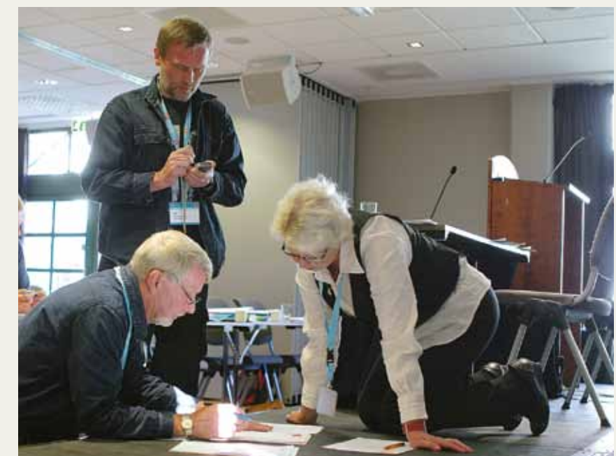
Valgmoro SST: Dirigentene sjekker at alt går etter boka.

– Fram mot 2030 vil antall eldre vokse kraftig og behovet for helsepersonell vil øke i samme takt. Ettersom teknisk landskonferanse. Fagforbundets søknad om fagbrev for byggrifere (tidligere vaktmester) gikk gjennom i Faglig råd for bygg- og anleggsteknikk i april.