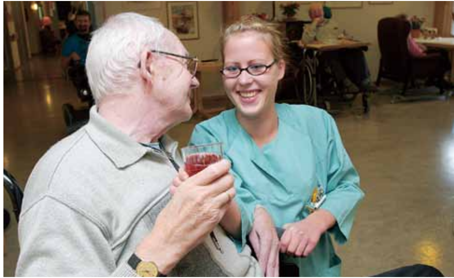
Manko: Helsefagarbeidere blir mangelvare når rekrutteringen saktner.

– Det er viktig å få hele stillinger, for om en kandidat ser at det bare er småstillinger å få, er det en god grunn til å velge bort lærlingtilværelsen.